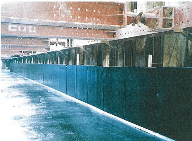
▲地下構造物に使用

AOIエラストイトは、米国ASTM D994-98 及びAA SHTO M33-70規格の全項目に合格する良質のアスファルトマスチック成型目地板です。