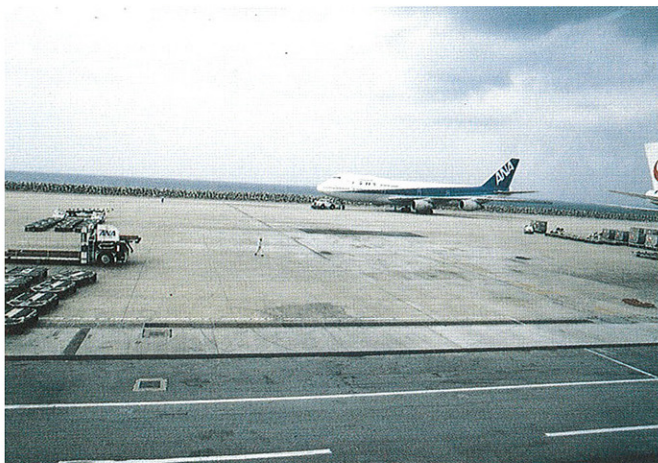
▲空港舗装の目地に使用