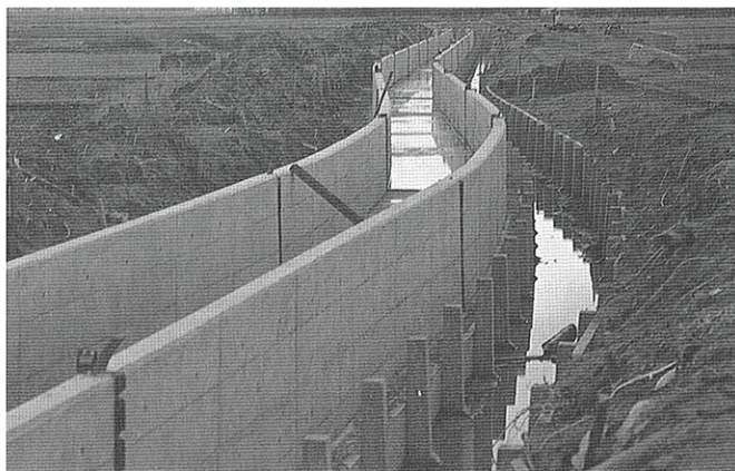
▲水路の目地に使用